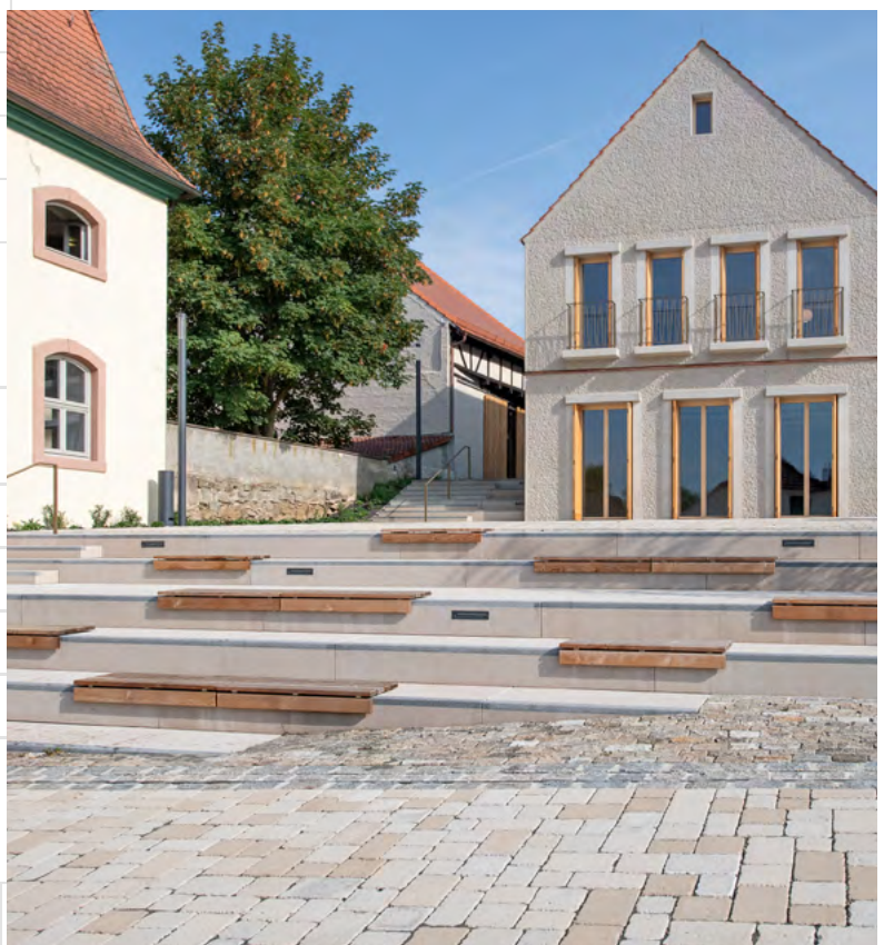
Sitzelemente und Stufen mit Kontraststreifen in Anthrazit-Uni und Aussparungen für Leuchten laden zum Verweilen ein.